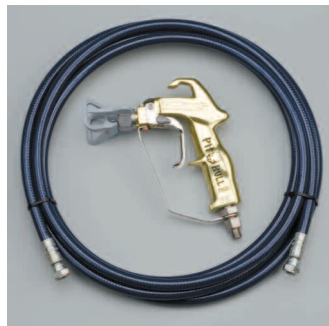
Nº Ref. A3500-2-75 Kit pistola, tubo y portaboquilla reversible (sin boquilla)