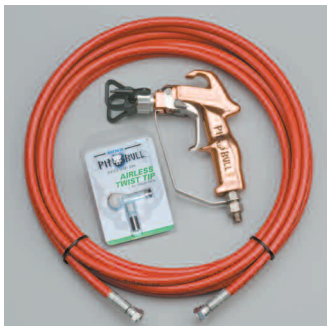
Nº Ref. A3500-2-75 Kit pistola, tubo y portaboquilla reversible (boquilla incluida)